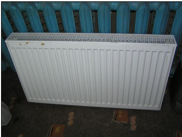
Рис. 1.8. Современный радиатор водяного отопления на фоне анахронизма эпохи — старого радиатора "гармошки"

Существует множество моделей радиаторов; они отличаются типом, размерами, количеством секций, мощностью, надежностью, методом крепления (вертикальные, горизонтальные) и классом прочности прибора, производителем. Тем не менее, по внешнему виду они очень похожи (рис. 1.8).