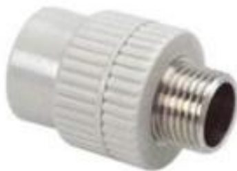
Рис. 1.5. Соединительные фитинги из полипропилена