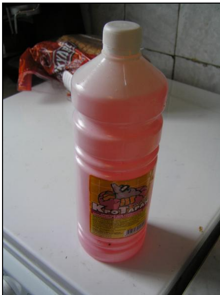
Рис. 1.3. Растворитель для прочистки сливных труб

С течами наиболее эффективно борются путем замены труб. Об этом мы поговорим далее.