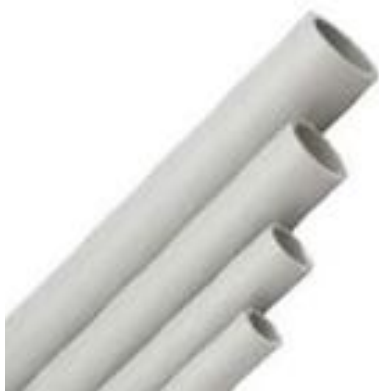
Рис. 1.4. Полипропиленовые трубы

Полипропиленовый соединительный фитинг представлен на рис. 1.5.