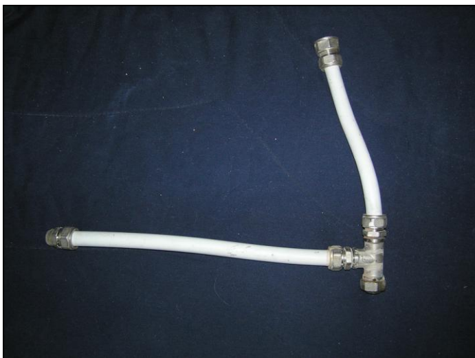
Рис. 1.9. Подготовленная перемычка из полипропиленовых труб

Сегодня принято устанавливать перемычку (чтобы при отключении именно вашего радиатора в квартире не страдали от холода остальные этажи). Ранее перемычку (рис. 1.9) устанавливали только в том случае, если в доме однотрубная система теплоснабжения и требуется регулировать подачу воды в радиатор.