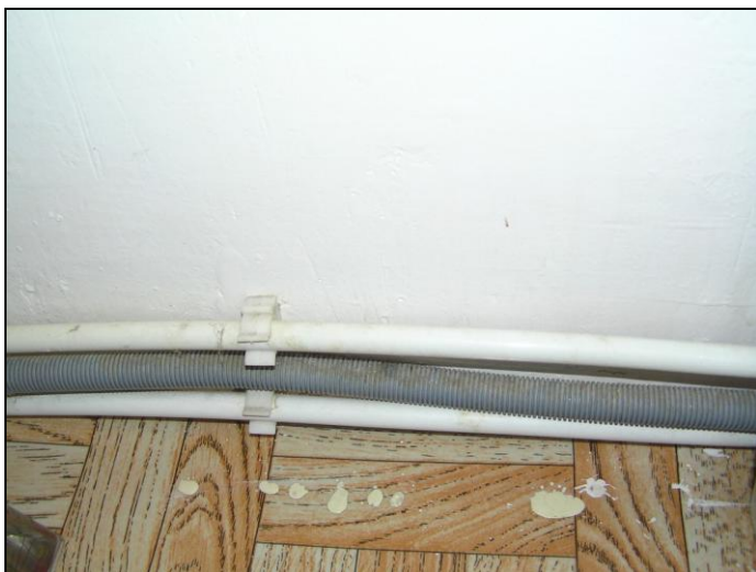
Рис. 1.6. Полипропиленовые трубы подвода горячей и холодной воды