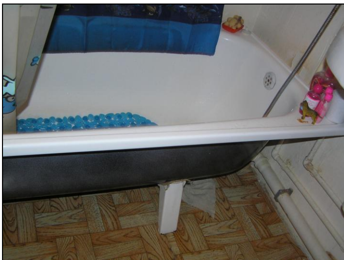
Рис. 1.7. Полипропиленовая фановая труба (слив) от ванны