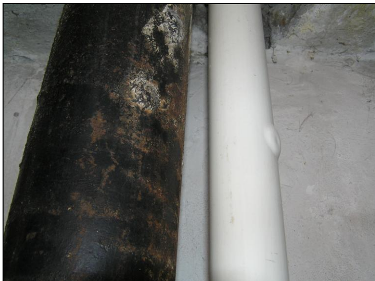
Рис. 1.2. Псевдобрак-нарост на трубах

С другой стороны, на пластиковых трубах визуально могут быть видны шишки-наросты внешним диаметром 4—5 см (у непрофессионалов создается впечатление, что трубу давлением воды распирает изнутри, и она вот-вот лопнет); многих домохозяек это пугает, но неисправностью не является. Такой "псевдобрак" (рис. 1.2) случается даже на новых, еще не установленных трубах.