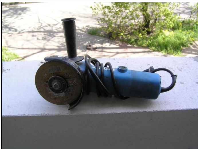
Рис. 1.10. Портативная болгарка с диском диаметром 115 мм

Болгарка (рис. 1.10), даже самая простая и портативная с обрезным кругом 115 мм — незаменимый инструмент для любого ремонта и других видов деятельности.